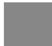
Gris Silver Ral 9006