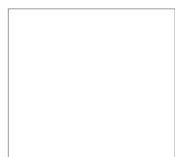
Blanco Ral 9003

Nota: El contenido del presente catálogo, está sujeto a revisiones periódicas, por lo que lo invitamos a inscribirse en nuestro sitio web para recibir las fichas actualizadas, o bien visitar constantemente nuestra página para descargar la última versión. Fecha Versión 1, Octubre 2010