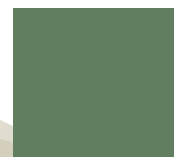
Verde Musgo Ral 6011