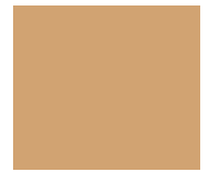
Beige Ral 1001